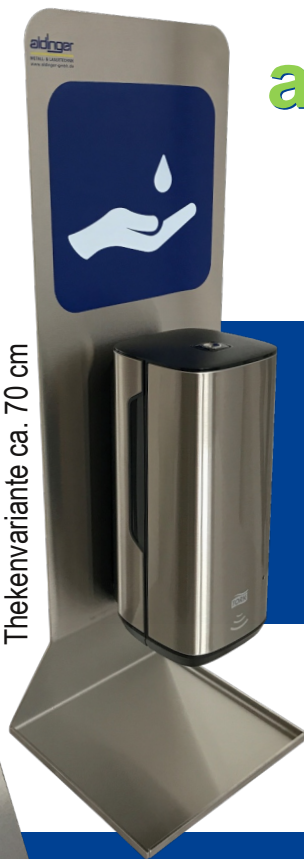
Thekenvariante ca. 70 cm